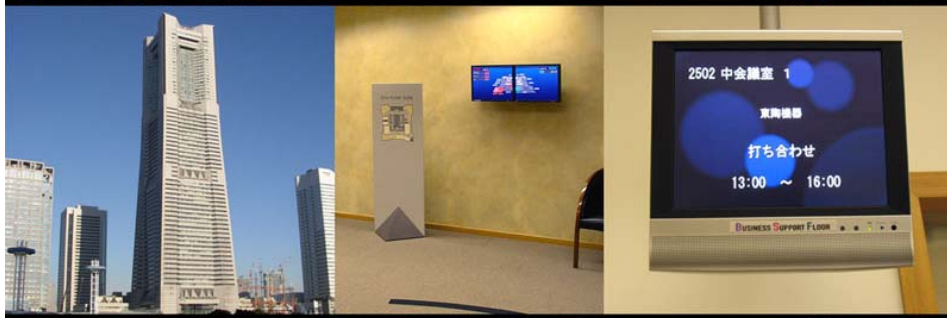
横浜ランドマークタワー 三菱地所ビルマネジメント(株)様施工