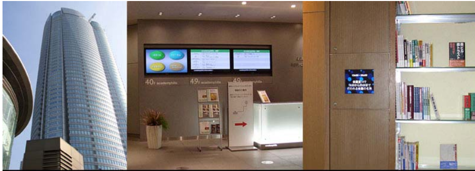
六本木ヒルズ (株)東和エンジニアリング様施工