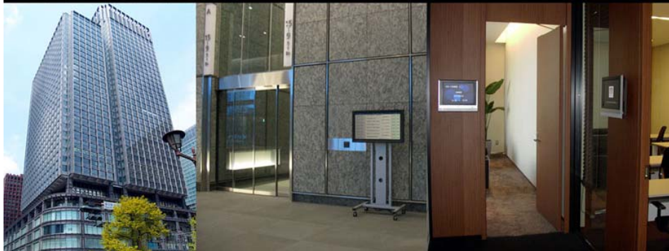
新丸ビル 東光電気工事(株)様施工